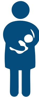
PESSOAS COM CRIANÇAS DE COLO