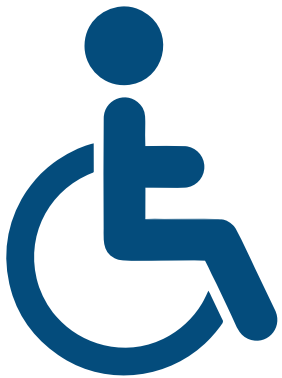
PESSOAS COM DEFICIÊNCIA