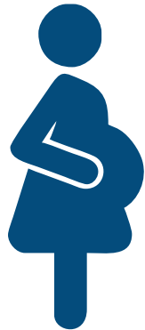
GESTANTES E LACTANTES