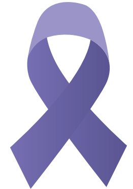
PORTADORES DE FIBROMIALGIA

(Obrigatória a apresentação da carteirinha municipal)